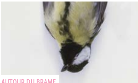
AUTOUR DU BRAME