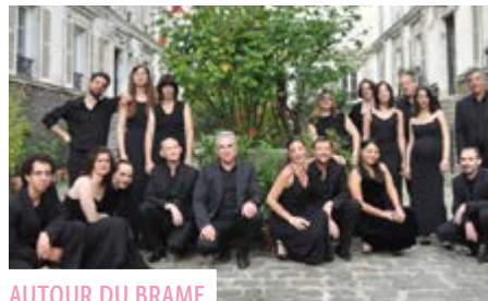
AUTOUR DU BRAME