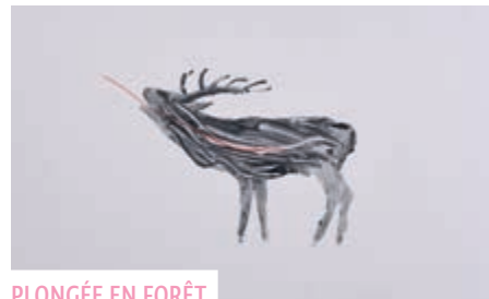
PLONGÉE EN FORÊT