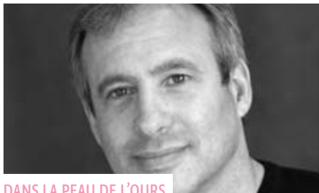
DANS LA PEAU DE L'OURS