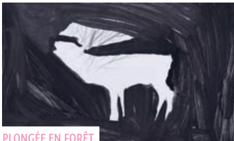
PLONGÉE EN FORÊT