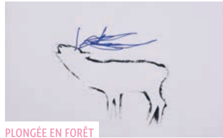
PLONGÉE EN FORÊT