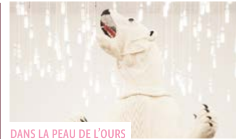
DANS LA PEAU DE L'OURS