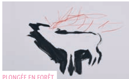
PLONGÉE EN FORÊT