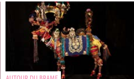
AUTOUR DU BRAME