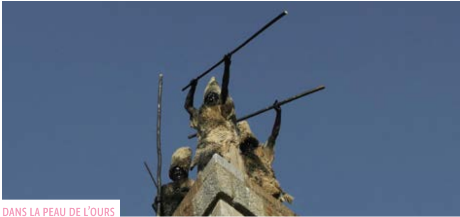
DANS LA PEAU DE L'OURS