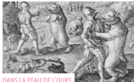
DANS LA PEAU DE L'OURS