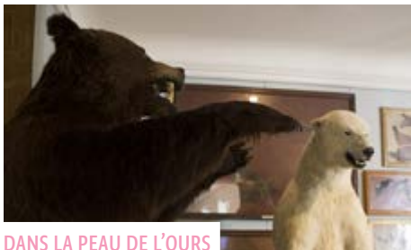
DANS LA PEAU DE L'OURS